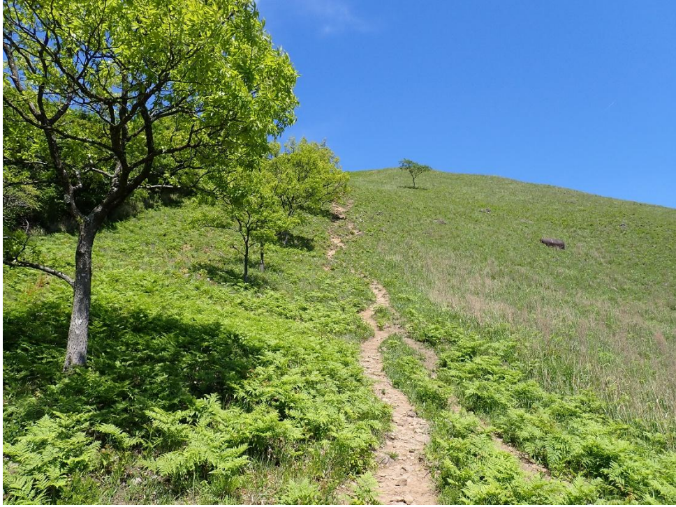
急登に喘ぐ 13:45 まだまだ先がある