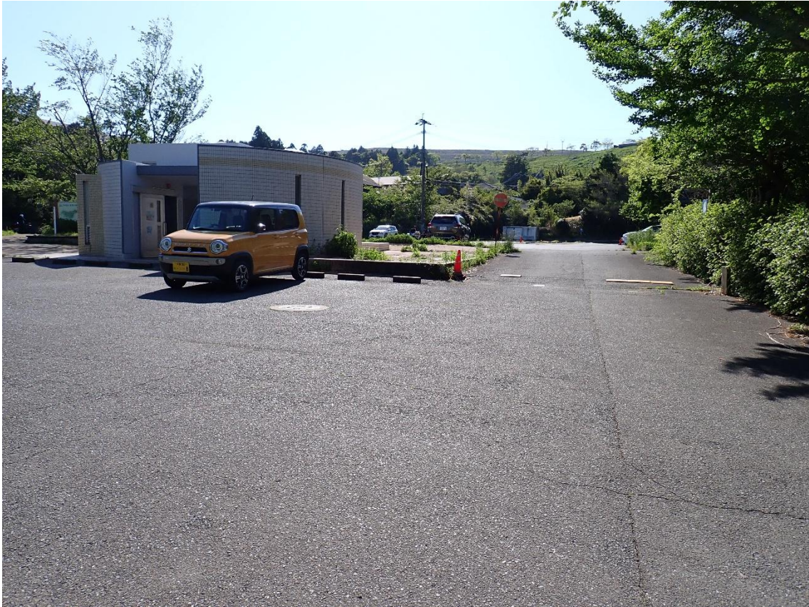
自然観察センター駐車場 15:53 ゴール

4時間30分の山歩きが終了 久しぶりの平尾台を堪能 スマホの歩数計は19477歩 お疲れ様でした。