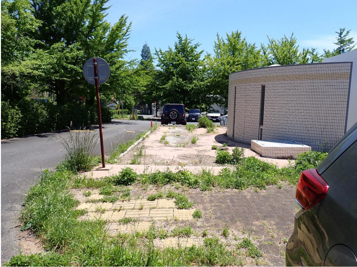
自然観察センター駐車場 11:23 遅い時間からスタート