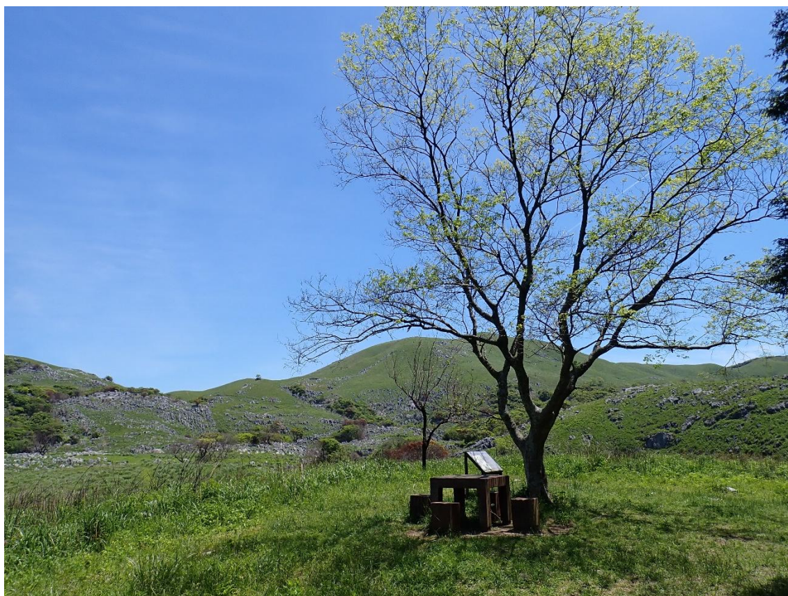
平尾山神社からの森を抜けると… 11:41 素晴らしい風景が目に飛び込んできた