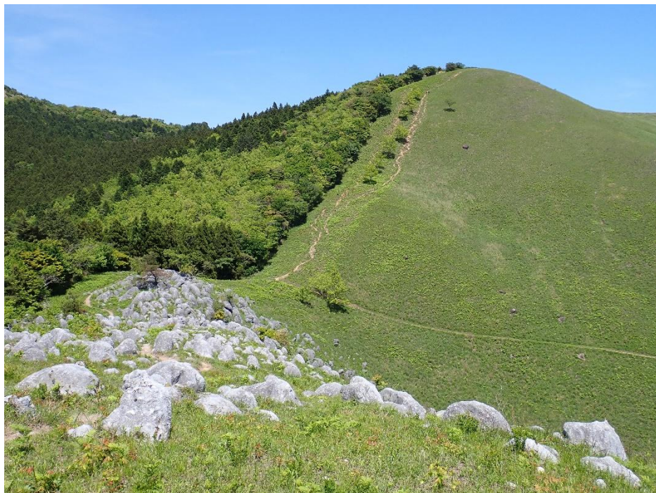
四方台への急坂が近くなってきた 13:34