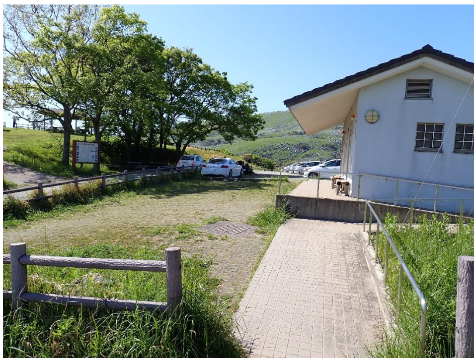
茶ヶ床園地 15:24 この時間でもまだ満車