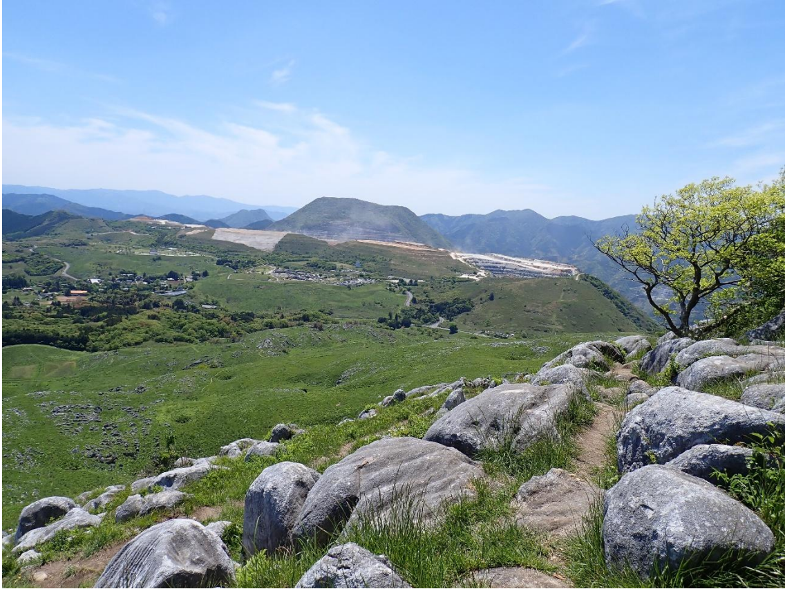
大平山山頂より吹上峠方面を望む