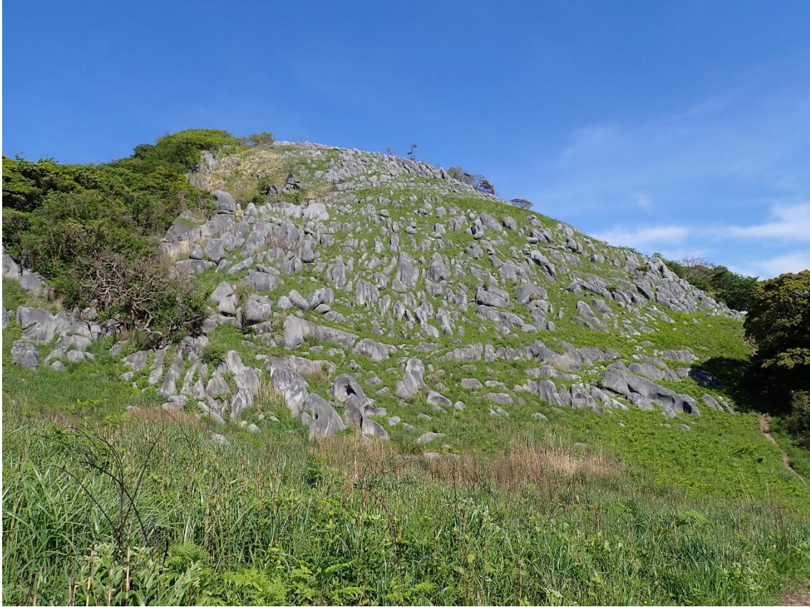
貝殻山が近づいてきた 15:32 右側の車道に出て自然観察センターへ