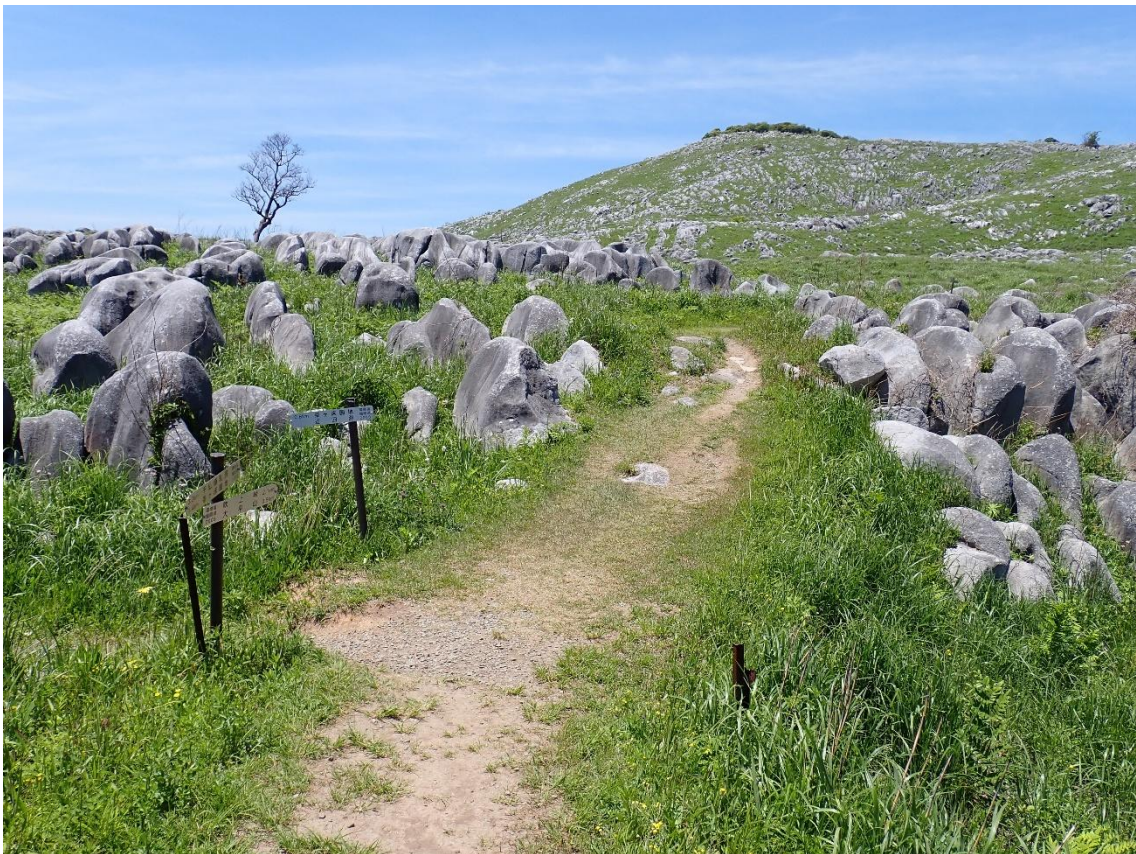
鞍外し 12:31 鉄管道を上り詰めると鞍外しの分岐となる ここから大平山を目指すことにした