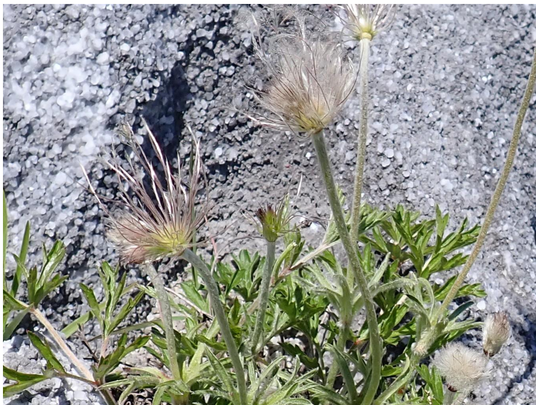
オキナグサは既に果実になっていた

オキナグサの果実は羽毛状の毛を持つ そう果 で、球状に集まり風で散布される。そう果とは薄くて硬い果皮の中に一つの種子が密着しているため、一見すると種子のように見えるが、果実の一種。イチゴやタンポポなど。