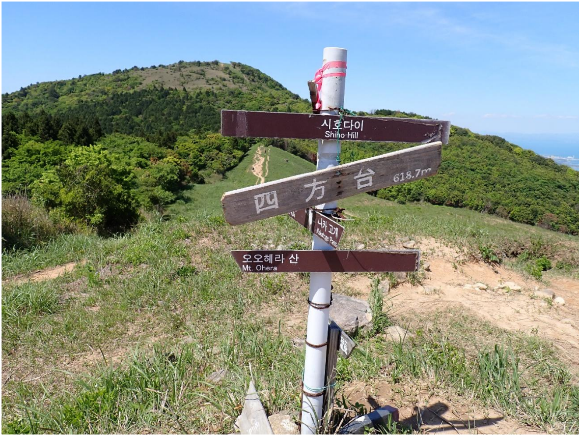
四方台 13:56 618m 後方に聳えるのはこれから目指す貫山