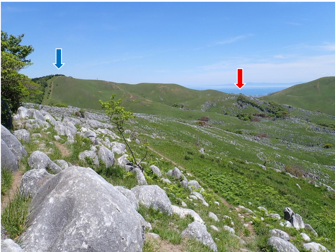
大平山山頂より岩山方面を望む(左端は四方台)