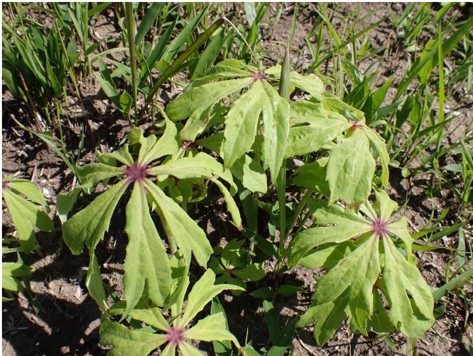
ヤブレガサは少し大きくなっている