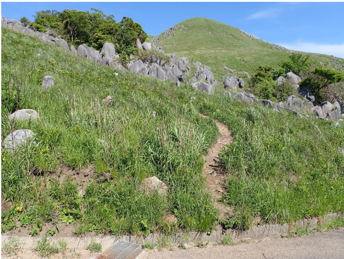
権現山への分岐を通過 15:17 つい登りたくなるが時間がないので次回にお預け