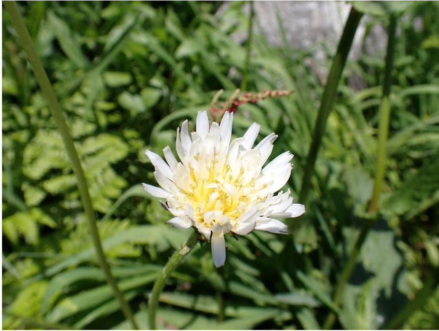
シロバナタンポポ