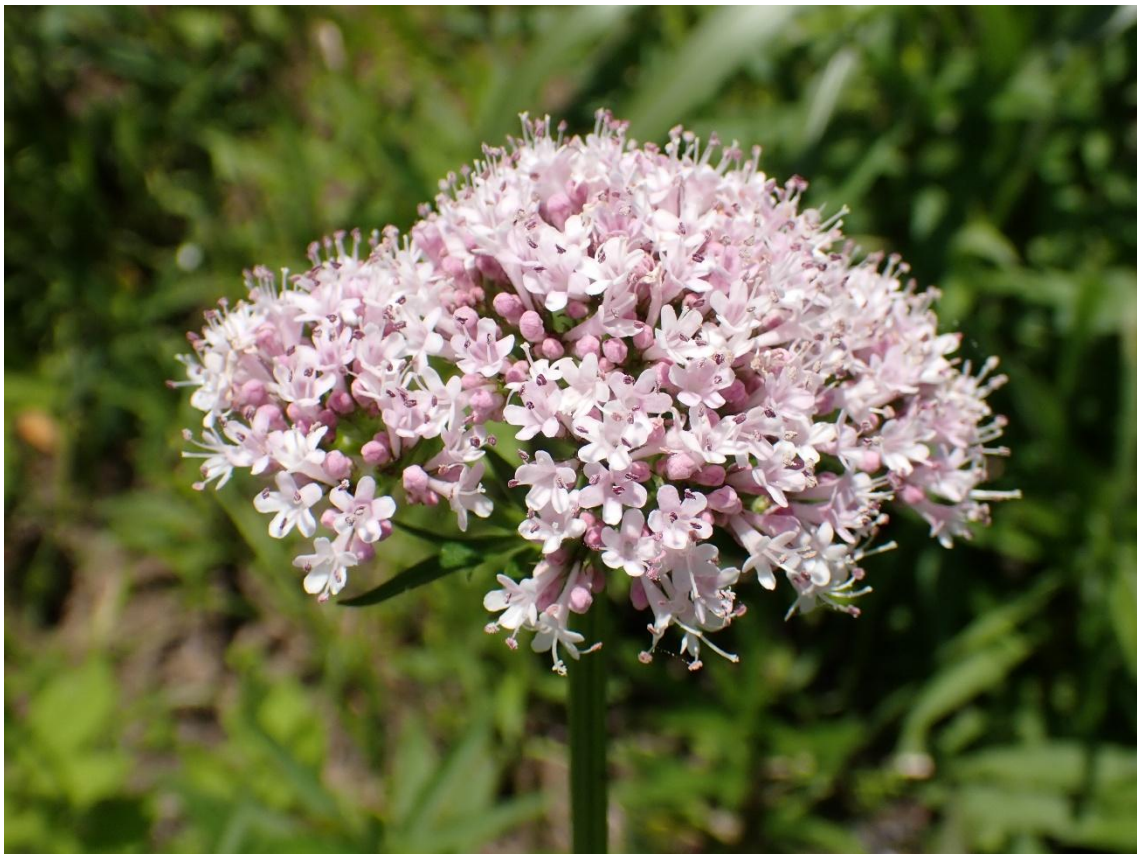
カノコソウがたくさん咲いていた