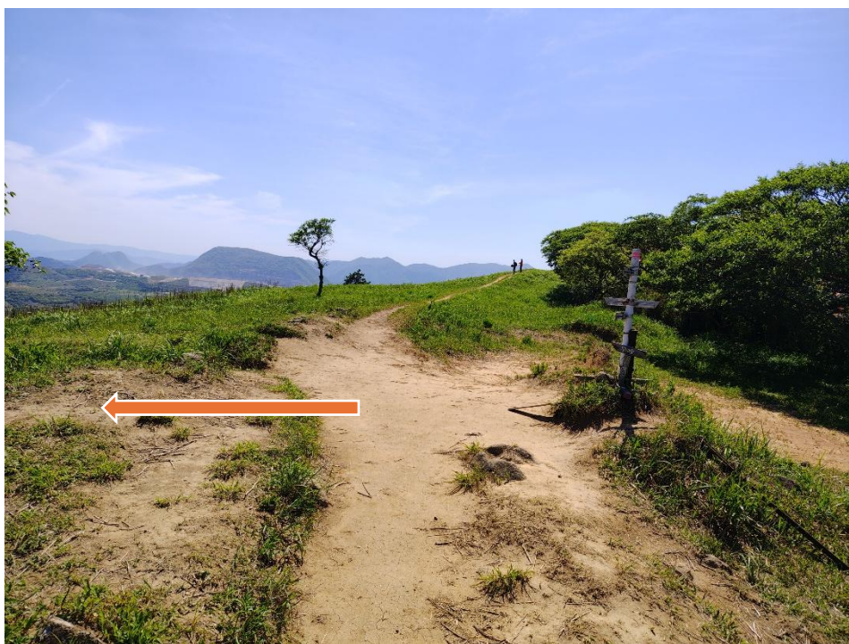
貫山から下山して四方台へ戻ってきた 14:41 ここから左に進んで岩山を目指す！