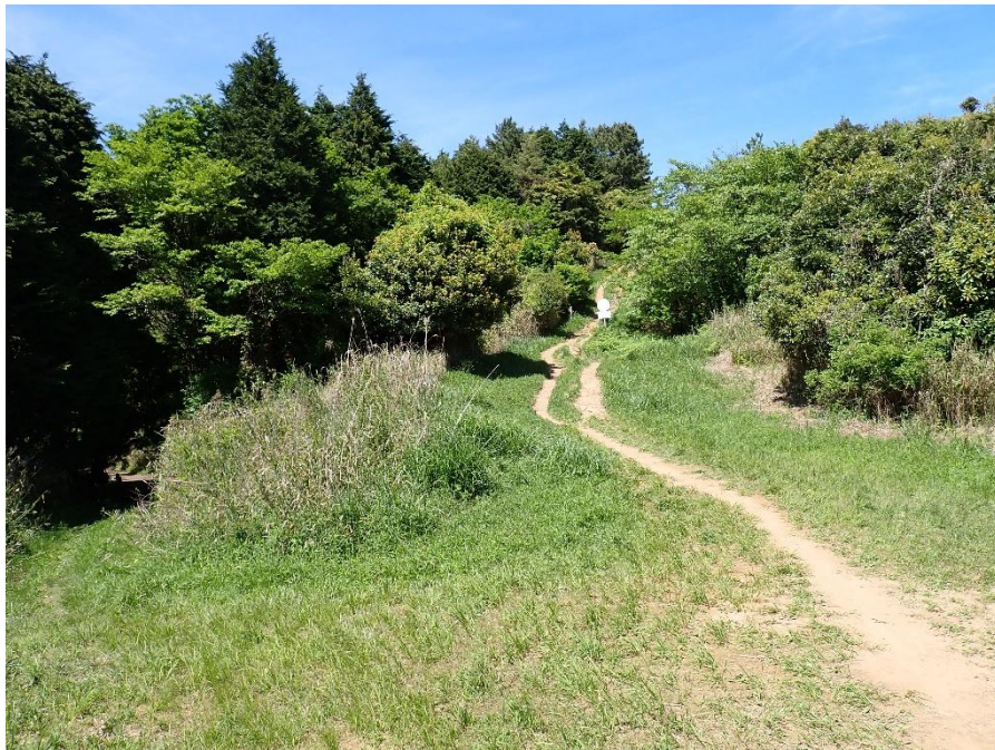
林道出会を直進して貫山へ 14:01 ここは分かり難いが十字路になっている 左へ進むと林道塔ヶ峯線へ。右へ進むと慰霊碑を經由して水晶山方面へと続く。