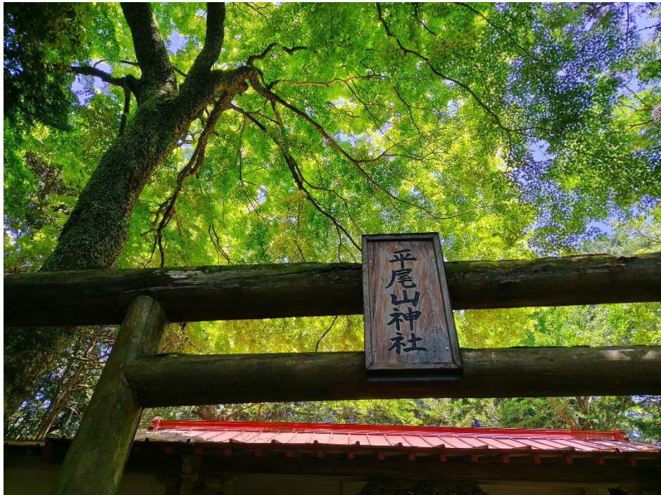
平尾山神社 11:31 安全登山参拝