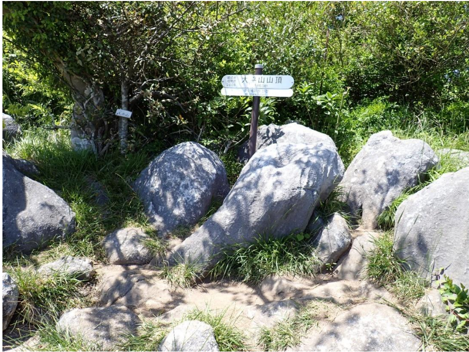
大平山(おおへらやま) 13:02 586m 小休憩後に貫山を目指す