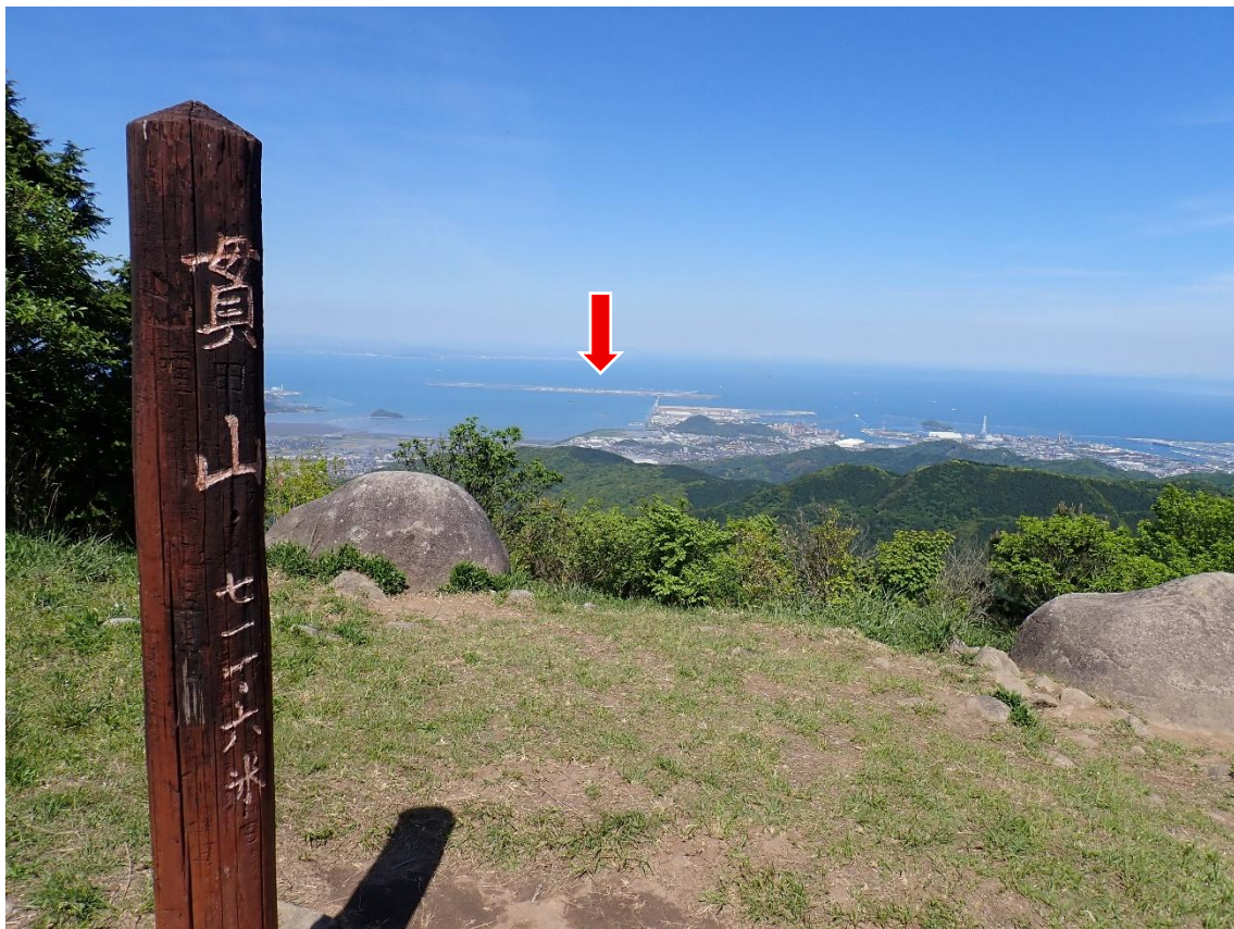
お天気がいいので、山頂から海に浮かぶ北九州空港がよく見える。