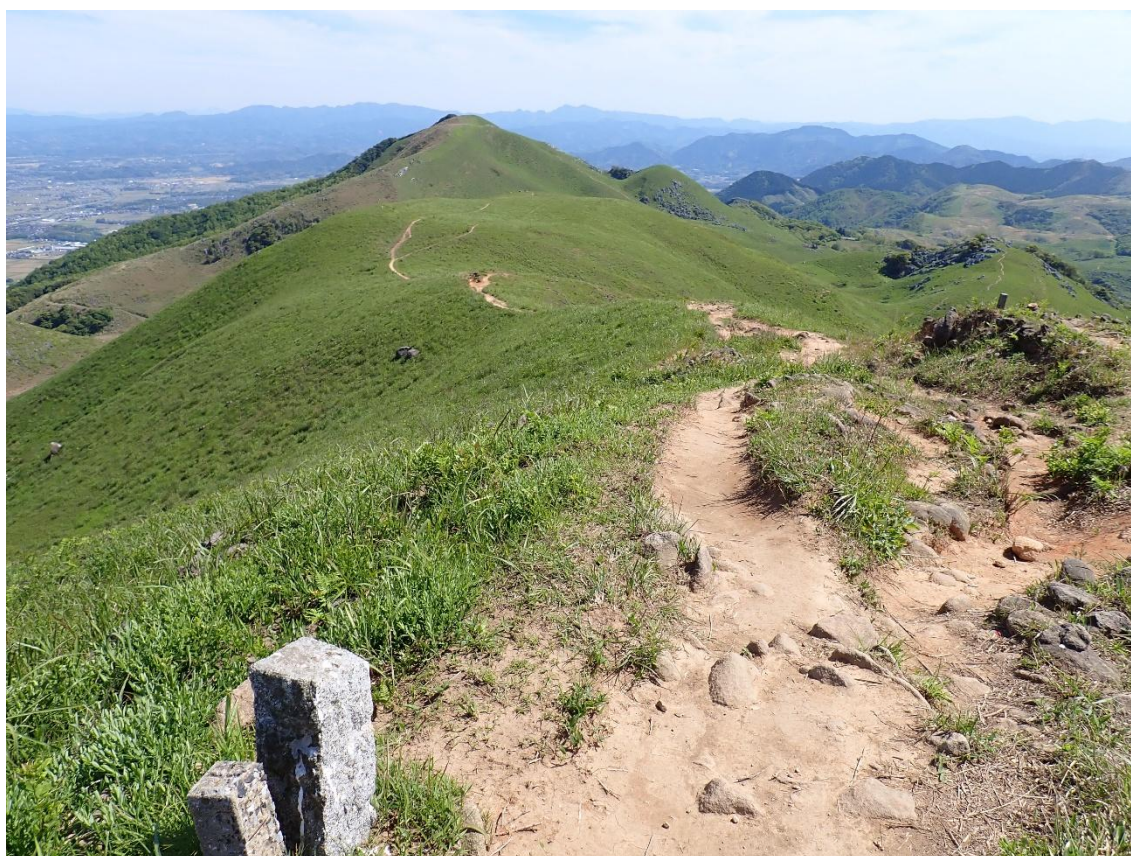
気持ちの良い稜線歩き