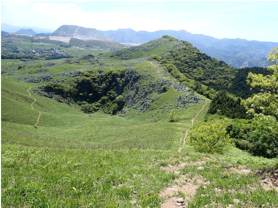
振り返ると大平山からのルートがクッキリ 13:49 左下は小穴