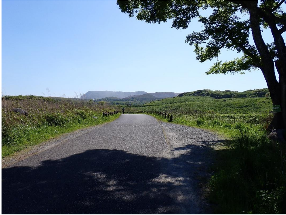
右に大きな木 15:38 左には堂金山への分岐がある