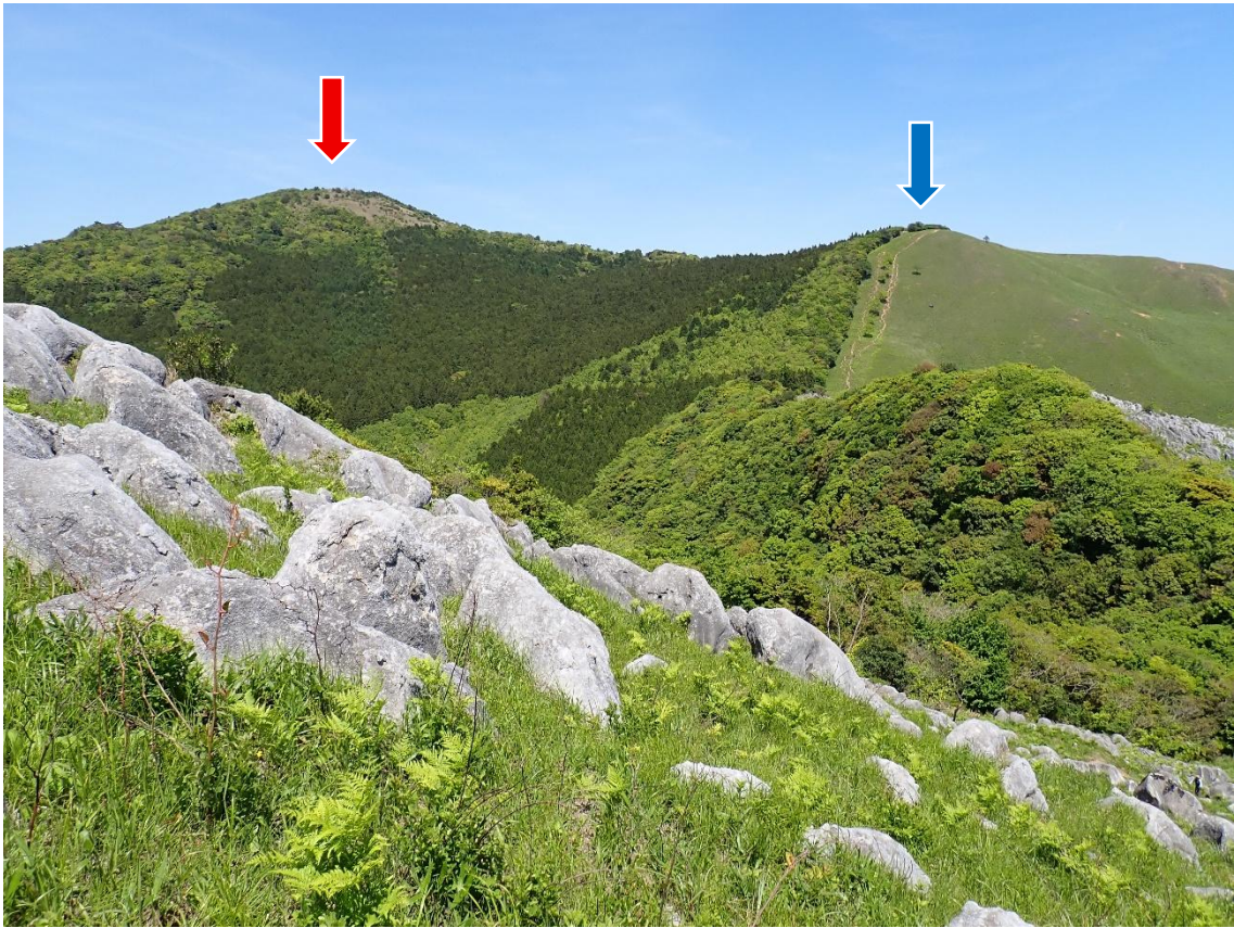
貫山と四方台が、くっきりと見える 13:21