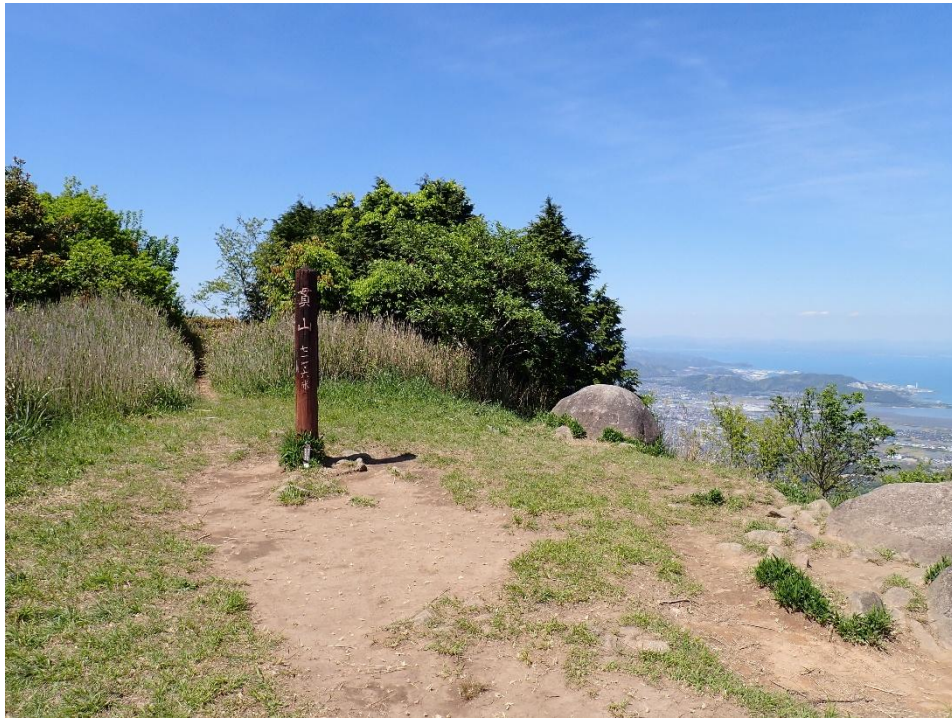
貫山 14:15 四方台から約 20 分で貫山山頂へ到着