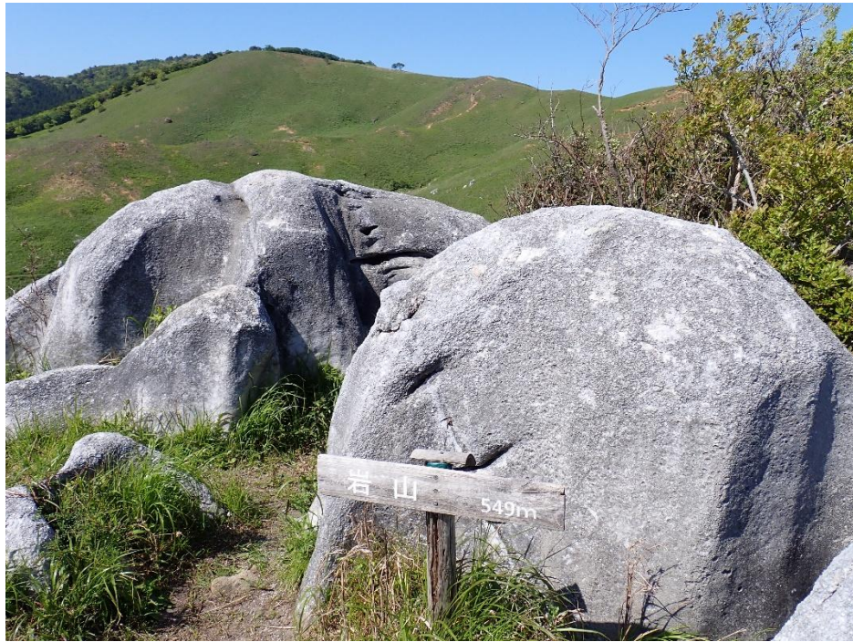
稜線から右に下って岩山に到着 15:01 549m