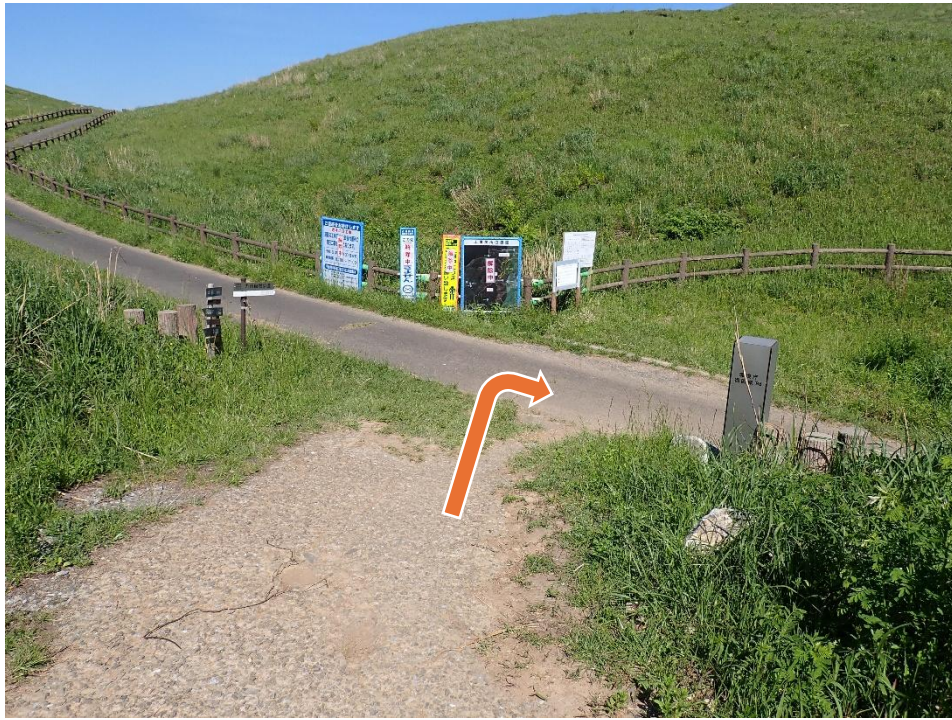
中峠 15:13 右に進んで茶ヶ床園地へ