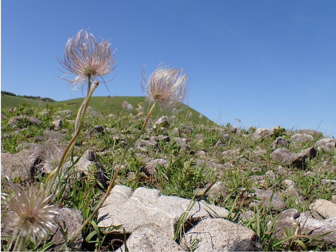
稜線歩きの途中にひげ爺さんを見つけた