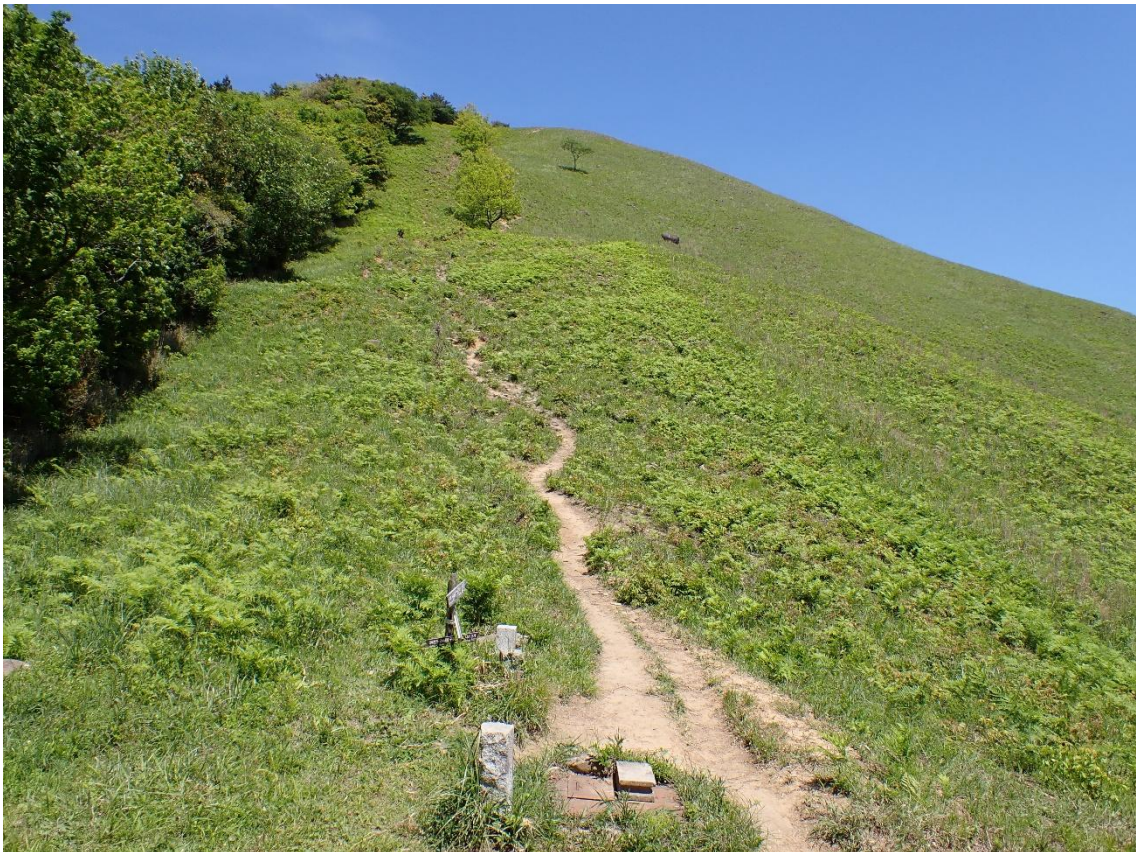
小穴十字路 13:41 見上げると気が遠くなる