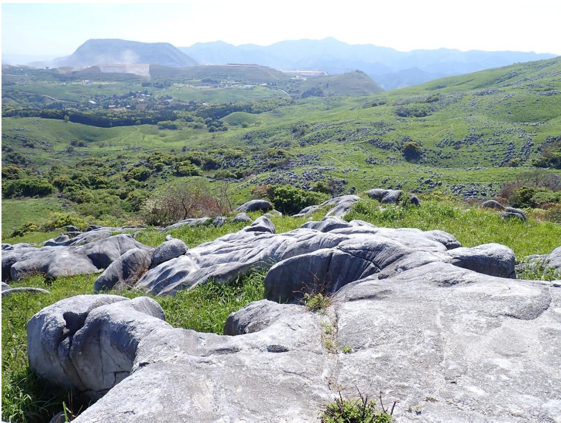
岩山にある大きな石灰岩の上で水分補給 15:03 眼下の茶ヶ床園地を眺める