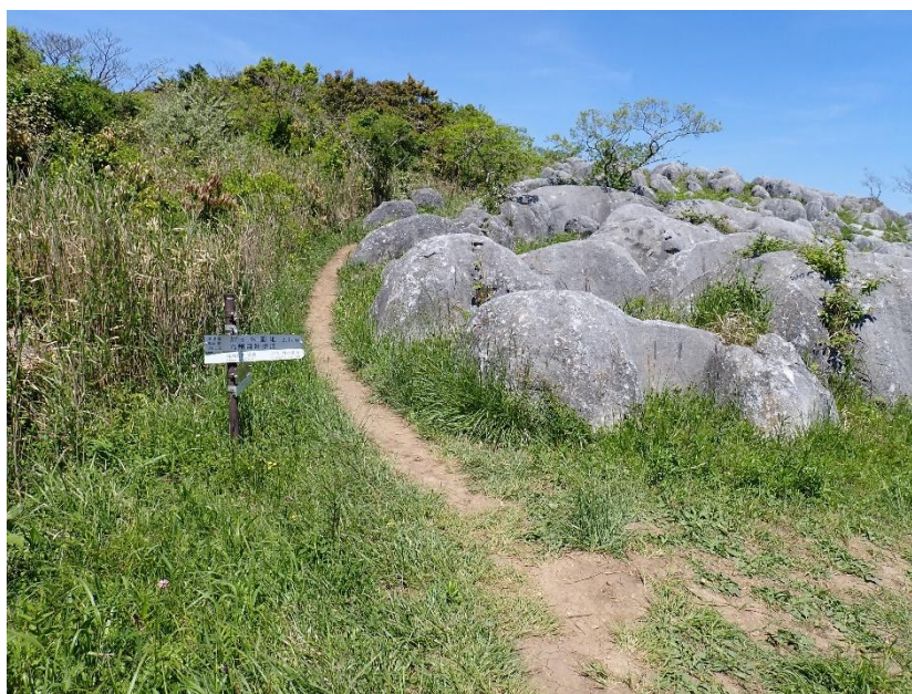
T字分岐を四方台方面へ 13:17 ここは鞍外しから上り詰めたT字分岐