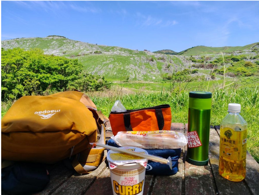
ベンチ 11:42 雄大な風景を見ながらランチタイム