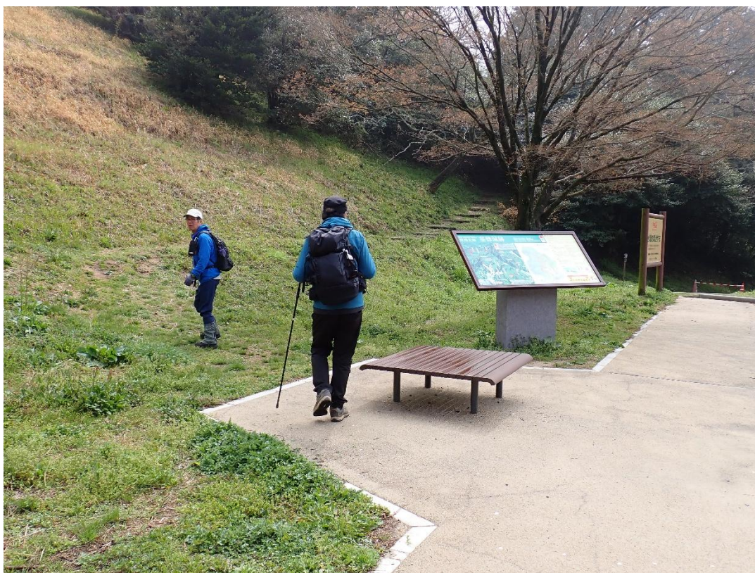
基山草スキー場前面広場駐車場 10:22 スタートの前に説明標識を見てみよう！