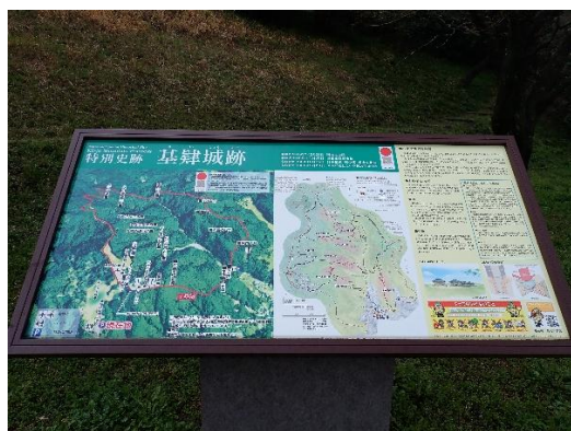
特別史跡 基肄城址の説明標識