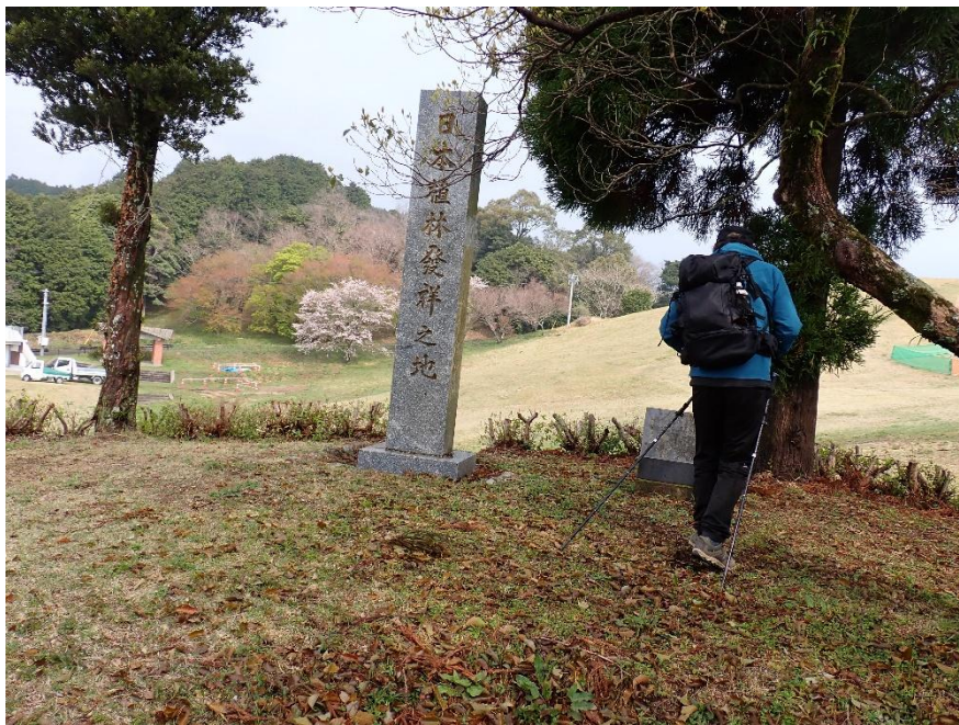
「日本植林発祥之地」の碑 10:28

基山は日本植林の発祥地として知られ、筑紫の名の発祥地でもあります。日本最初の植林地と伝えられ、貝原益軒や久米邦武博士によって「筑紫」とはここ「きのやま」(基山)と断定されています。(ネット調べ)