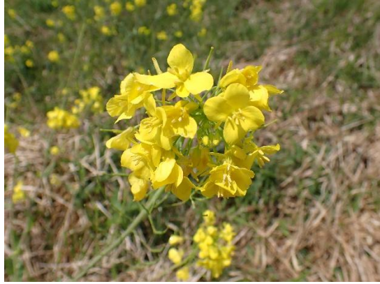
菜の花(セイヨウアブラナ?)