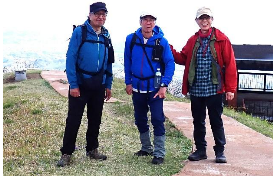
昼食後、三人で記念撮影 12:28 下山に取りかかる