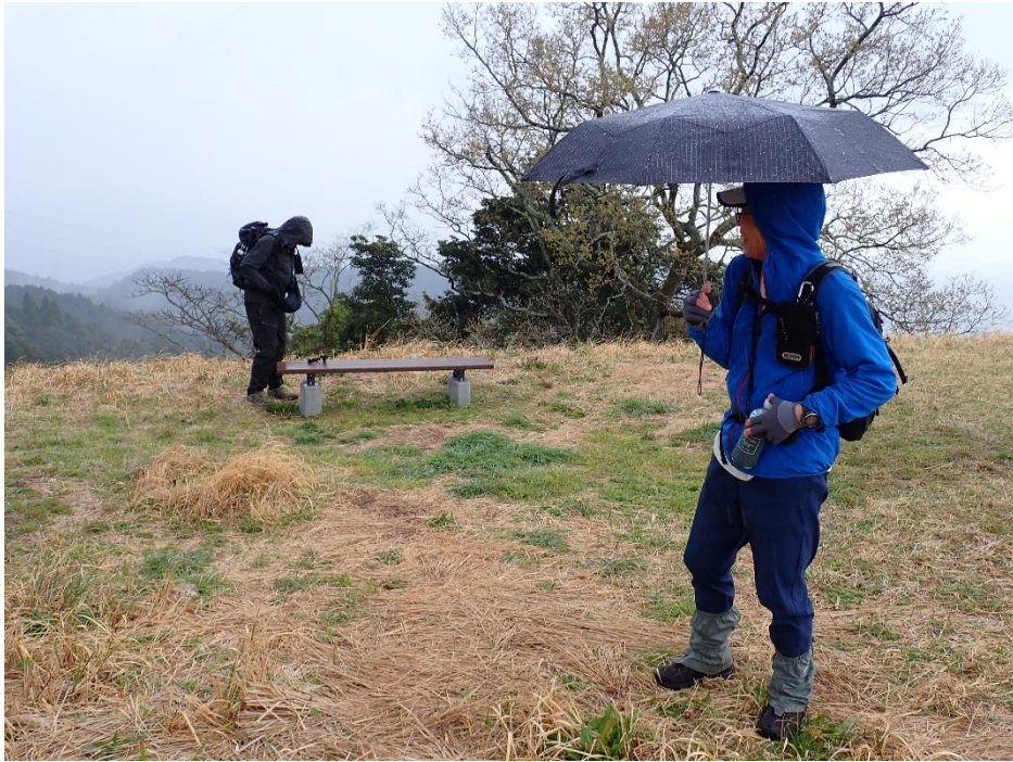
山頂に登頂したと思ったら・・・急に空が暗くなり雨が降ってきた 10:48