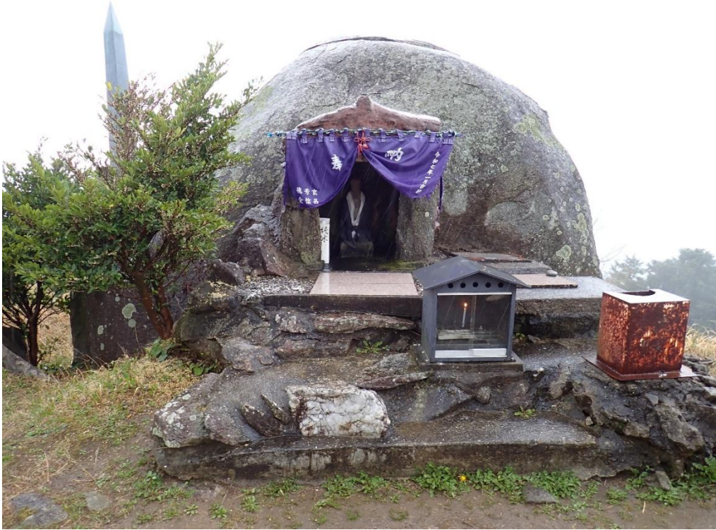
基山山頂 10:44 タマタマ石・荒穂神社磐座

基山頂上の高台その南端にある巨石は「タマタマ石」と呼ばれ 伝承では基山南麓にある荒穂神社（式内社）が当地にあった頃の磐座（神様の宿る岩）とされています。（ネット調べ）