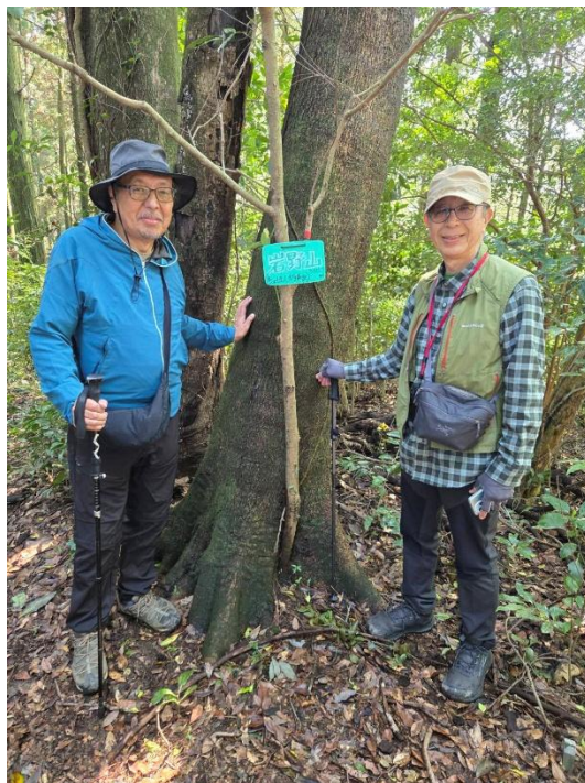
岩野山山頂 14:06 360m 10分程で登頂！展望なし 今日はこれで三座目。何れもニューピークで満足。