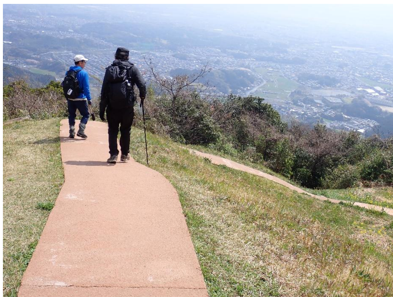
遊歩道を下って行く 11:37