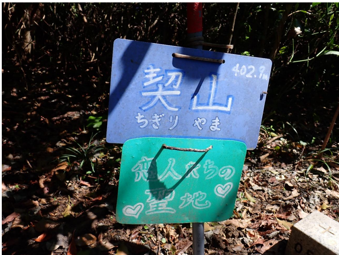
契山(ちぎりやま)の名前から、この場所は「恋人たちの♡聖地♡」となっている。