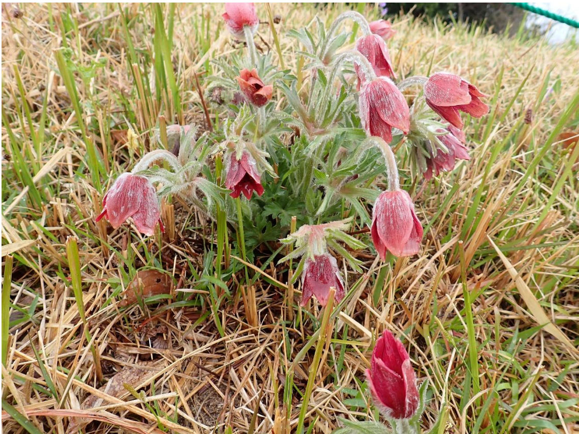
オキナグサが雨に濡れて首を垂れている 10:54