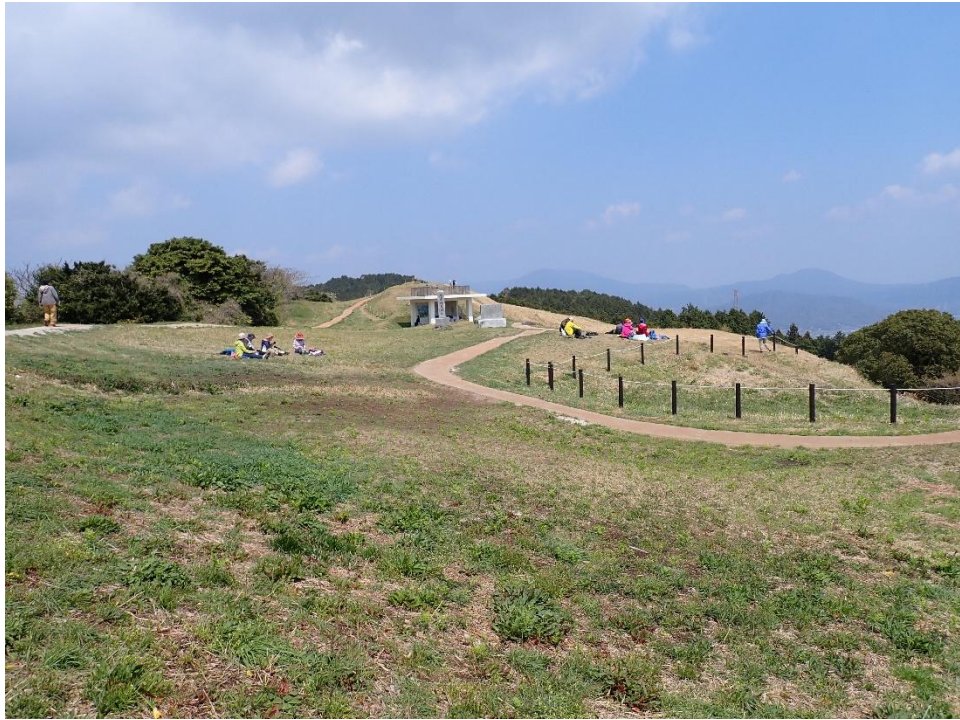
基肄城跡の広場では登山者がのんびり寛いでいる 12:37