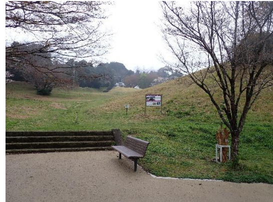
草スキー場を見上げる