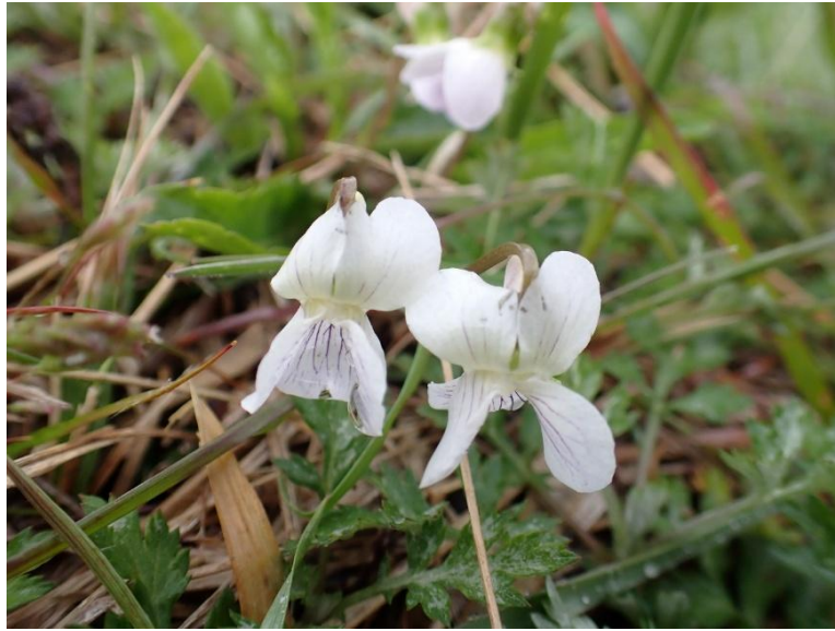
アリアケスミレ？ 可憐な白いスミレがポツン、ポツンと咲いていた。