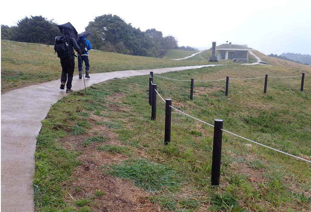
基肆(きい)城跡 11:00 雨の中、傘を差して進む