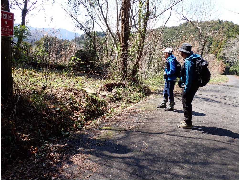
契山(ちぎりやま)登山口 13:10 路上駐車して本日二座目 スタート!