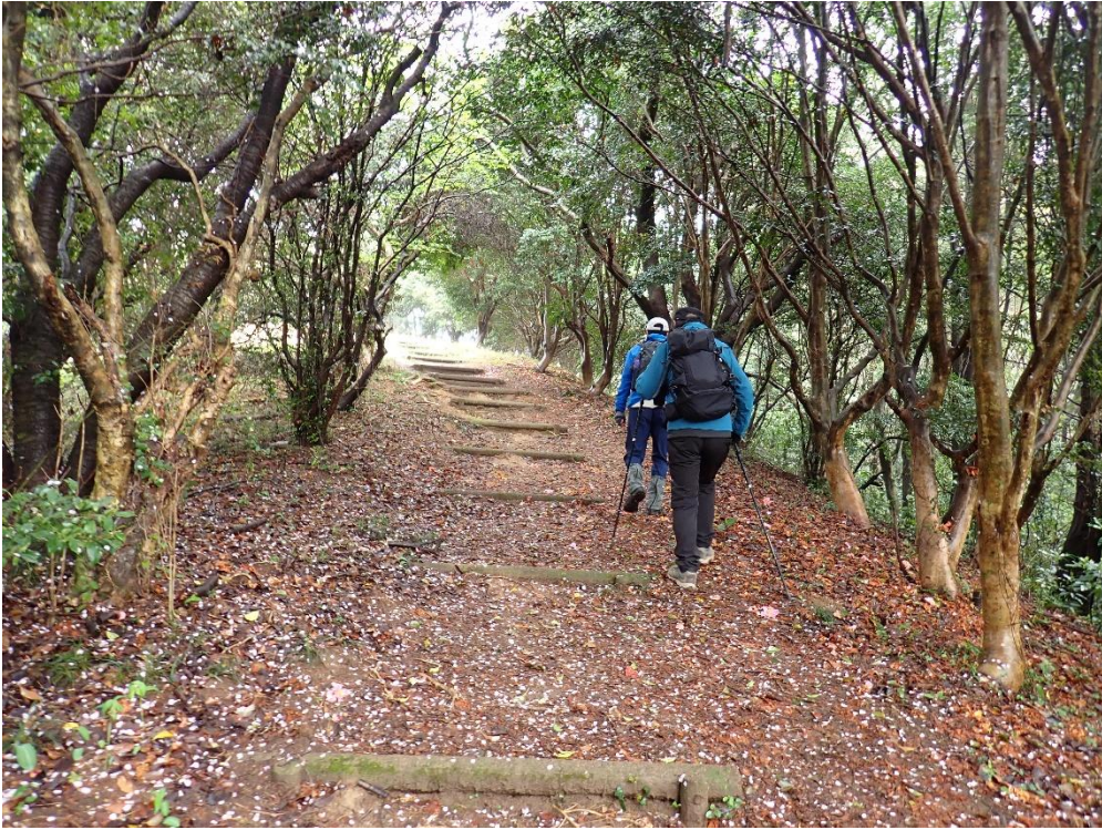
整備された遊歩道 10:25