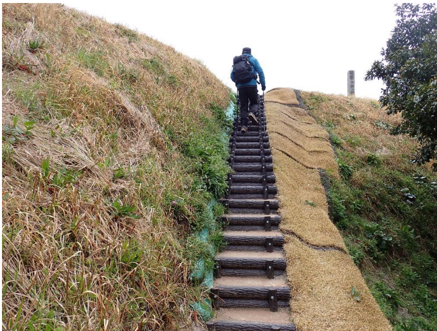
細長い階段を上る 10:42