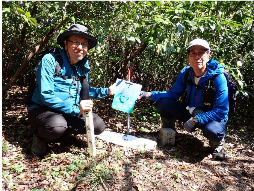
契山山頂 13:23 10分程で、あっという間に山頂到着。展望なし。