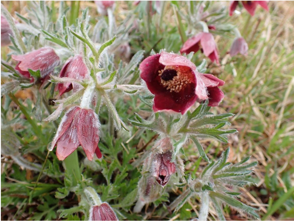
絶滅危惧種のおキナグサ(雨の中で撮影)