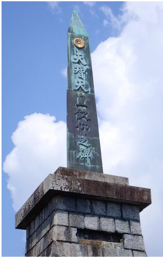
天智天皇欽仰之碑