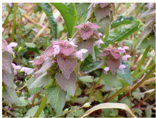
ヒメオドリコソウ