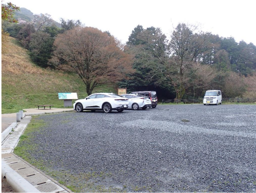
基山草スキー場前面広場駐車場 10:07 到着