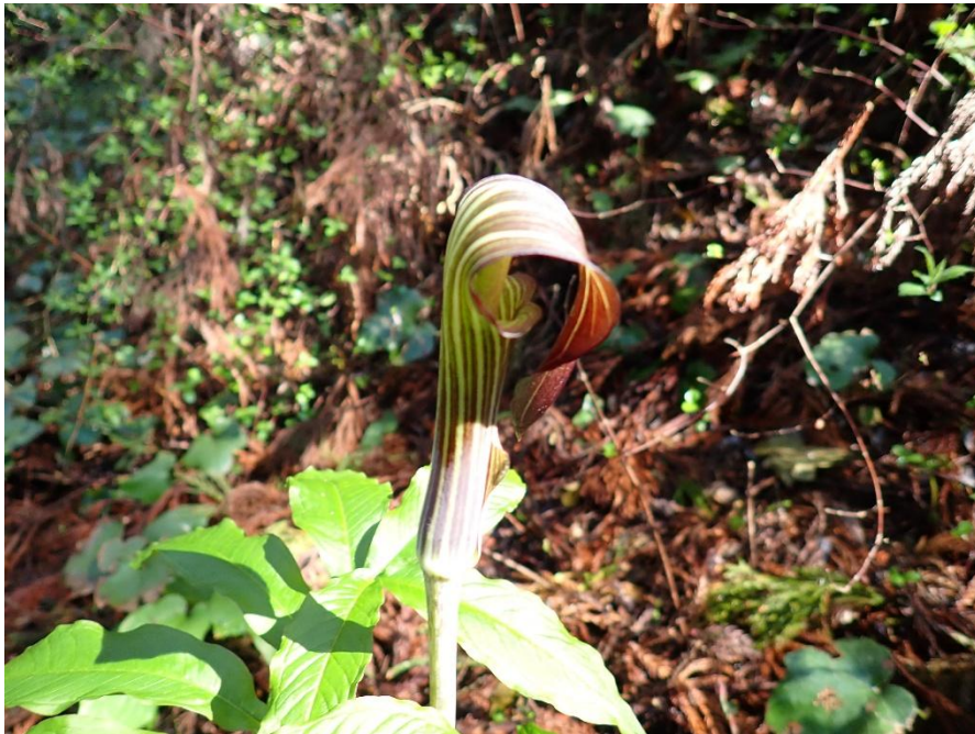
マムシグサがニヨキニヨキと・・・