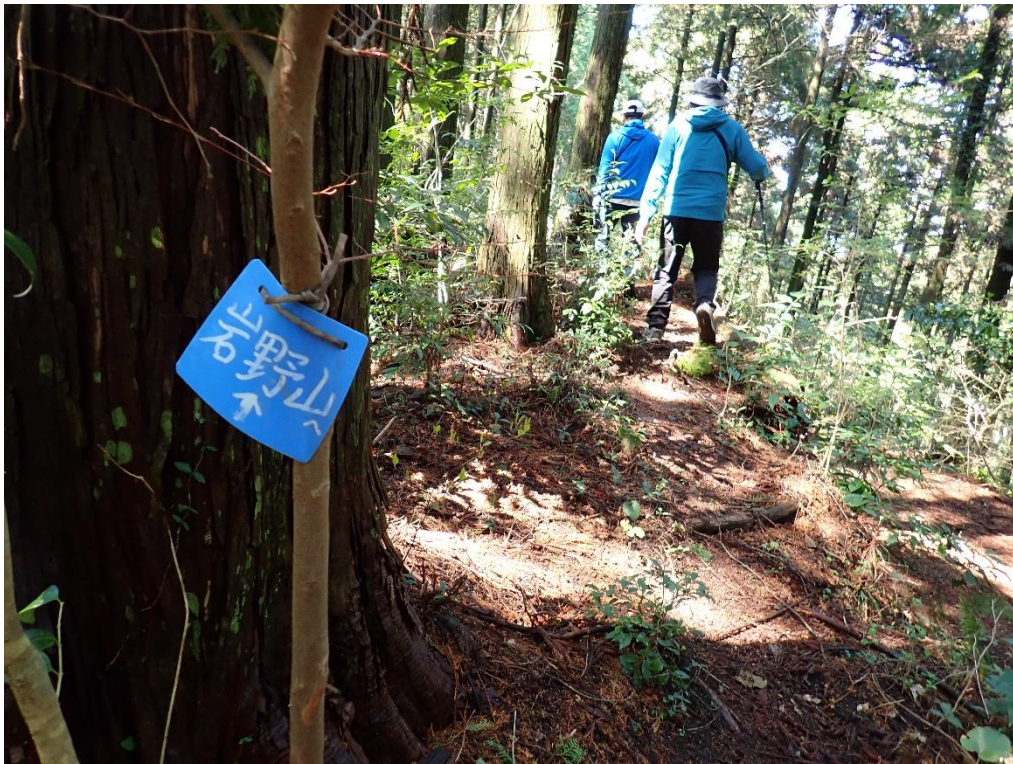
途中の分岐で左上の道へ 13:58