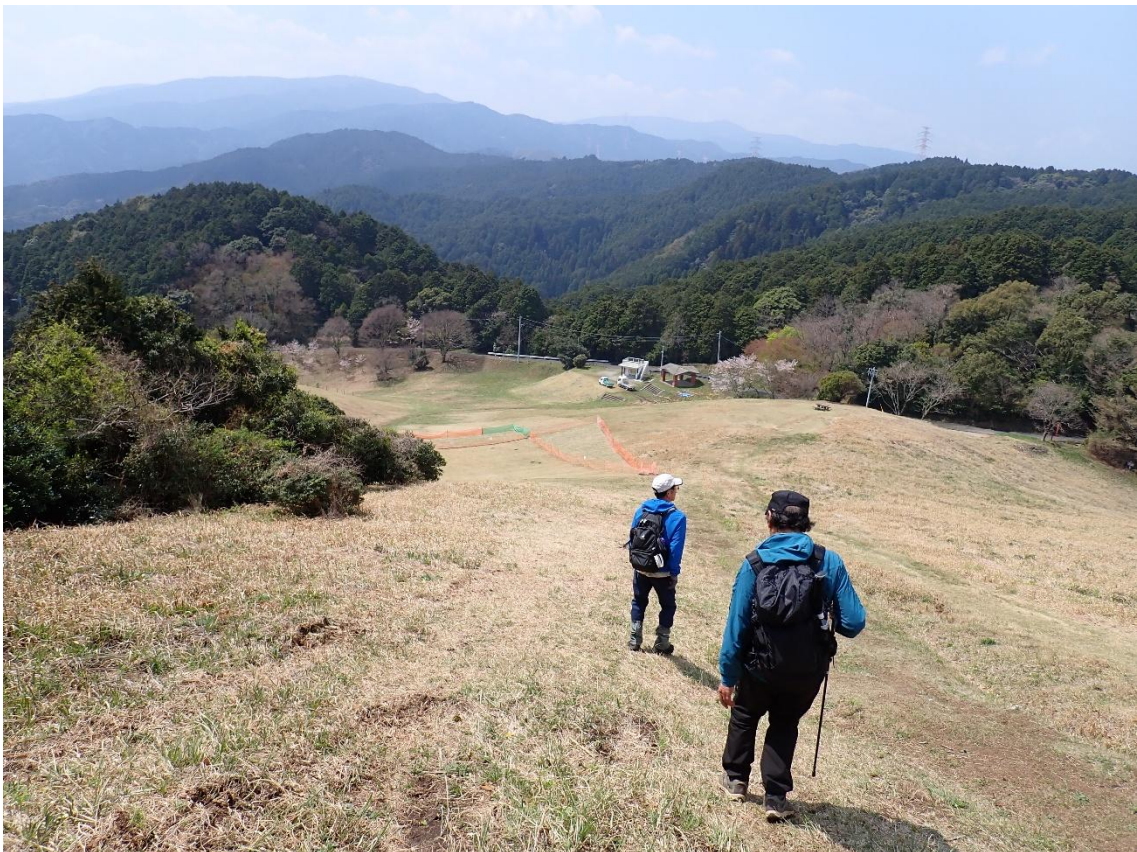
基山草スキー場 12:37 草スキー場を歩いて駐車場へ