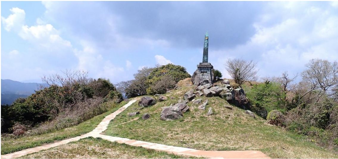
春の陽気の中で昼食…雨が止んで良かった 11:40 ~ <ベンチで昼食> ~ 12:22