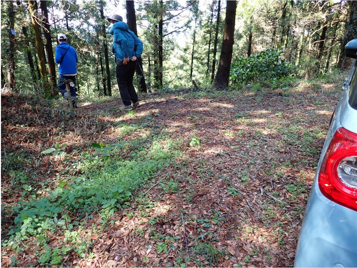
岩野山登山口 13:54 路肩に停めてスタート