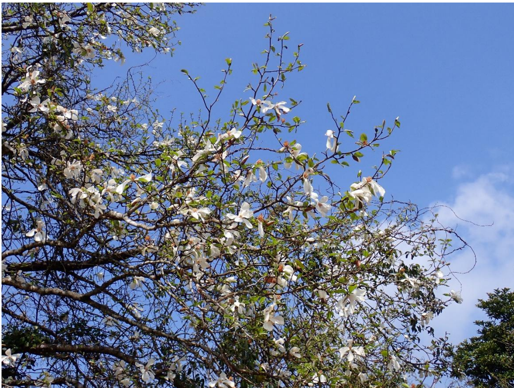
空がみるみると青くなってきた 11:18 盛りを過ぎたコブシが花びらを散らしていた