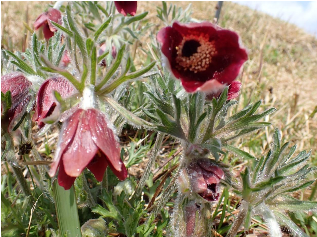
ロープで囲った植生保護地で見事に咲くオキナグサ。