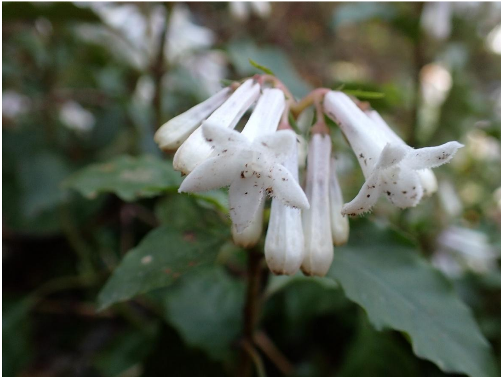
登山口近くにサツマイナモリがひっそり咲いていた