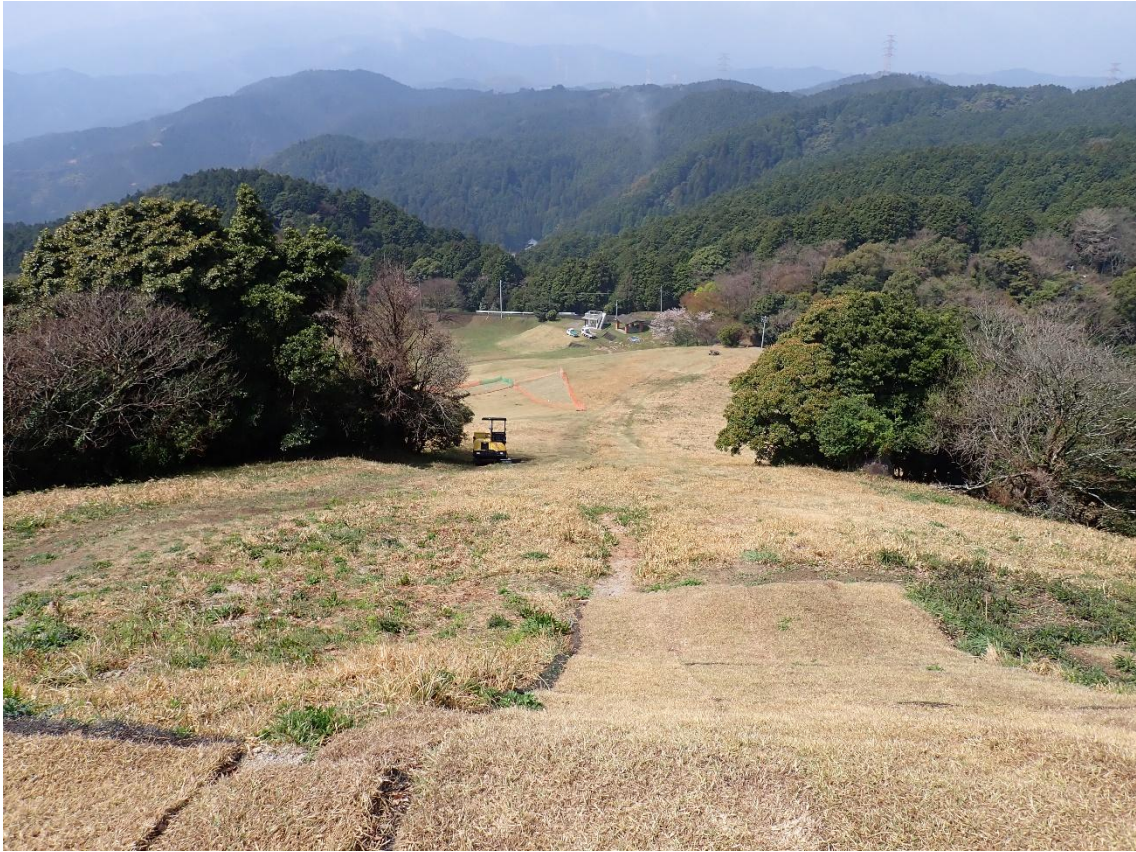
草スキー場の最上部にやって来た 11:25 上から見るとかなりの急勾配

お昼も近くなってそろそろランチタイムだが・・・ 再度山頂に戻り、山頂裏の展望を眺めながら昼食にすることにした