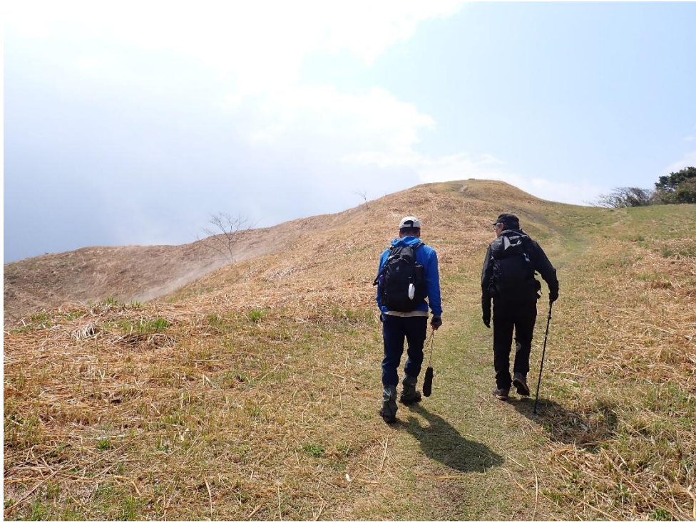
急に陽が射してきた。雨雲が通り過ぎたのだろう。 11:17 ここから九州自動車道の基山SAが確認できた！