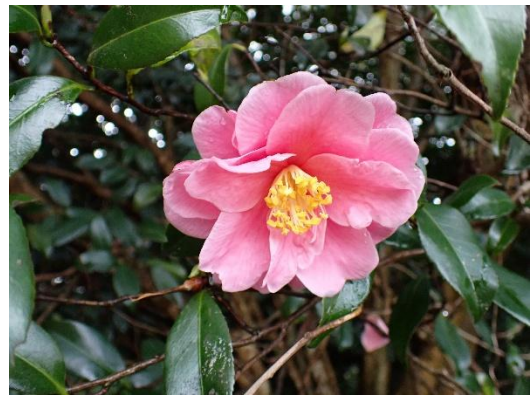
ピンクの八重ツバキ